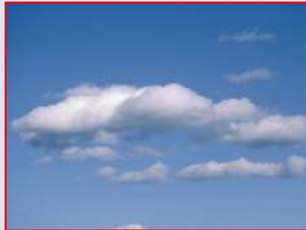
“half bewolkt met wind van achteren”

De algemene stelregel is voor programma duiven ongeveer 1 uur per dag, maar dan bedoel ik wel echt trainen, U weet wel wat ik bedoel.